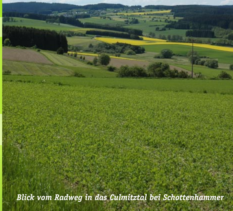
Blick vom Radweg in das Culmitztal bei Schottenhammer

Höhenradweg Naila – Schwarzenbach a. Wald